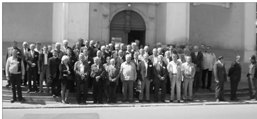
A konferencia résztvevői. Az augusztusi viszontlátás reményében kíván áldásos munkálkodást az erdélyi presbitereknek a partiumi küldöttség