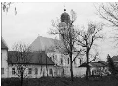
Egyházkerületünk Nőszövetsége a Nagybánya-óvárosi templomban tartja idei konferenciáját

Ezúttal szeretném tájékoztatni asszonytestvéreimet arról, hogy a Királyhágómelléki Református Egyházkerület Nőszövetségének XI. konferenciáját 2010. július 24-én tartjuk. Helyszín: Nagybánya-Óvárosi református templom.