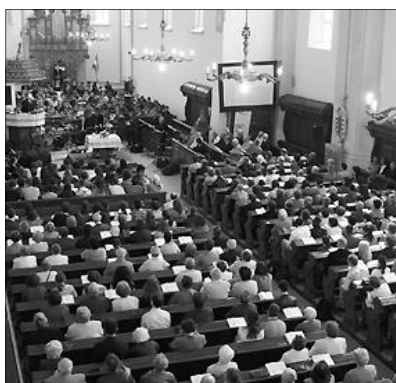
Hol a határ? Idén a marosvásárhelyi Vártemplomban keresték a választ a Függőleges Keresztyén Ifjúsági Konferencia résztvevői

Eközben a konferencia szenior résztvevőinek Falus András , a Magyar Tudományos Akadémia tagja, a Semmelweis Egyetem Genetikai, Sejt- és Immunbiológiai Intézet Tanszékvezetője tartott előadást Teremtő ember címmel. A kutató nem materialista, a szónak az idealista megközelítésében – mondta a genetikus – mert aki e tekintetben materialista, az nem tud kérdezni, vagy ha kérdezni tud, akkor sem érdeklí igazából a válasz. 1953. április 25. óta az ún.