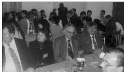
A negyedik alkalommal szervezett jótekonysági bál a hadadi Dégenfeld Református Egyházi Központ megújulását szolgálta

Az ünnepi beszédek után kulturális műsorra került sor, melynek keretében először a Hadadi Általános Iskola tanulói léptek fel, majd a szilágynagyfalui Bíró Bánffy György Kulturális Társaság Kék Nefelejcs színjátszó csoportjának ünnepi előadása következett.