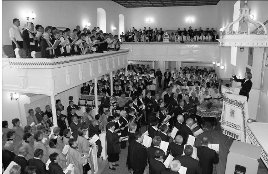
A tizenkét kórus a szabadon választott énekeket követően közösen adta elő Gárdonyi Géza: Énekeljete az Úrnak című darabját

A Szilágysomlyói református templom adott otthont május 9-én az immár nyolcadik Egyházmegyei Kórustalálkozó-nak. Egyházmegyénkből 11 énekkar jelentkezett, akikhez csatlakozott a házigazdák testvérgyülekezetéből, a nyírbátori Kálvin Kórus.