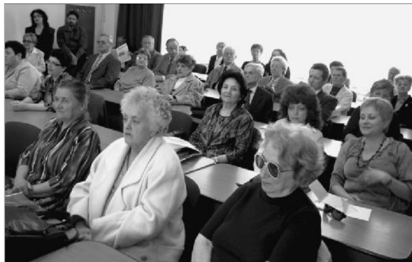
A résztvevők egy része az ünnepségen

Reménnyel telt meg szívem. Lelkem, teroem, álmaim újra átjárja a Harangszó, a Feltámadott szava.