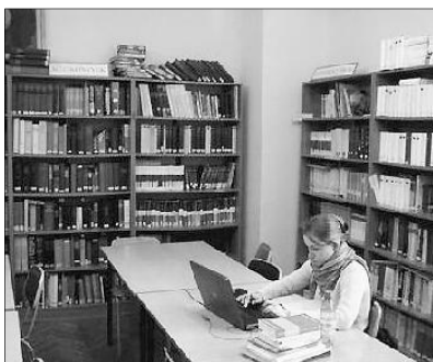
A teológiai könyvtár

Tokár Sándor szerint hátránya is van annak, hogy a bentlakásban is elérhető az internet. A diákok kevesebb alkalommal ülnek le beszélgetni egymással, ritkábban szerveznek közös programot, a közösségi élet beszűkült. Ezt az is elősegítette, hogy körülbelül egy esztendeje tilos az intézet-