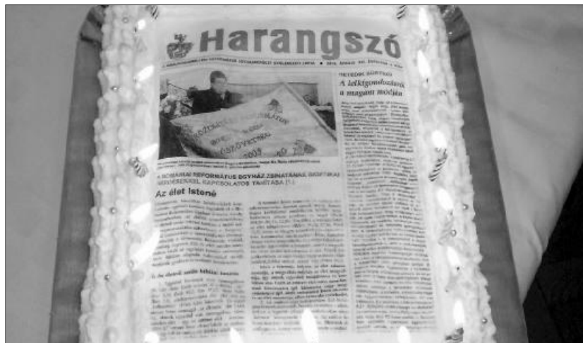
A húszéves Harangszó „ehető kiadása” az utolsó morzsáig elfogyott