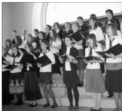
A Refsonor kamarakórus

TEMESVÁRON ÉS ARADON VENDÉGSZEREPELT A REFSONOR KAMARAKÓRUS. Április 11-én vasárnap, a Temesvárbelvárosi gyülekezet délelőtti istentiszteletén lépett fel a sepsiszentgyörgyi Református Kollégium Refsonor kamarakórusa. Aznap az Arad-mosóczi gyülekezet délutáni istentiszteletén is szolgált a kamarakórus. A fellépést közös ifi-est követte a gyülekezet fiataljaival.