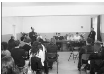
A vetélkedőn Isten igéjének megismerése volt a tét, ahol mindenki látható és lelki értékeket nyert

Kollégiumonként három diák és egy kísérőtanár érkezett, így a helyi csapattal együtt 36 személy vett részt a versenyen. A megérkezés öröme túl ismerkedéssel folytattuk az együttléteket, és hogy még szórakoztatóbb és szorosabb legyen a kezdődő barátságok köteléke, vendégeinknek egy gitáresttel kedveskedtünk. A gitárest első felében a kollégiumunk közkedvelt zenetanára és az általa alakított több, mint tíz tagból álló zenészcsoport megzenésített verseket ad-