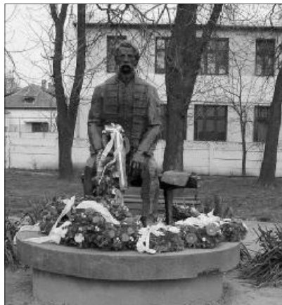
Arany János szobra Nagyszalontán

Arany János életművének minden darabja hitét és református gondolkodását tükrözi. Sokat emlegetik a hatalmas Toldi-trilógiát. Méltán. Rövid balladái okán azonban „a ballada Shakespeare-jének” nevezhették el. Minden egyes balladája bibliai alapkérdést fogalmaz meg. Témája: a bűnbűnhődés-kegyelem. Mindnyájunknak számot kell adnunk életünkről a nagy Isten színe előtt. Nem emberi mérce, hanem az is-