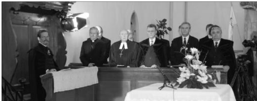
A Kárpát-medencei magyar történelmi egyházak képviselői a marosvásárhelyi Fekete Március áldozataira emlékeztek

Tőkés László püspök, EP-képviselő beszédében összefoglalta: a marosvásárhelyi eseménynek húszéves évfordulóján több helyszínen emlékeztek meg. A Terror Házában Petőfi Emléklappal tüntették ki a magyarok oldalán harcba szálló cigányokat, Brüsszelben az Európai Parlament épületében szervezett konferenciát az erdélyi képviselő irodája. Az egykori temesvári lekipásztor