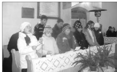
A gyermekek verses-zenés műsora