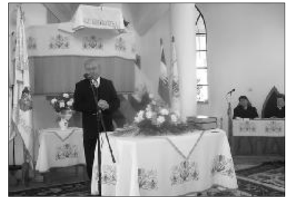
Csúry István püspök, előadásában a nőszövetségek fontosságát is hangsúlyozta

Húsz éve, 1990. március 23-án a kolozsvári teológia dísztermében tizenhárom lelkesítő gyűlt össze, ahol elhatározták, hogy ki-ki a saját egyházmegyéjében megalakítja a nőszövetséget. Az elhatározást tett követte, bár még ma is vannak olyan egyházközségek, ahol nincs szervezett formája a nőszövetségnek. A jubileumi év alkalmából évkönyvet adnak ki, mely a tervek szerint tartalmazza az elmúlt esztendő fontosabb eseményeit. Várják a nőszövetségek bemutatkozó írásait, a zászlók bemutatását, verseket, imákat, fényképeket, melyeket legkésőbb május 1-ig az egyházmegyei nőszövetségi elnökökhöz kell eljuttatni.