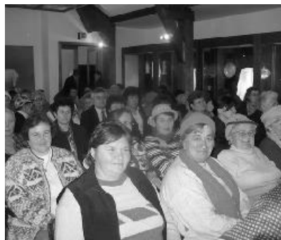
Mosolygós arcokkal telt meg a Lorántffy Központ múzeumterme

kész vetített képes előadásából megtudhatjuk, hogy az alig fél Erdélynyi országban alig kétezres lélekszámú magyar református közösség él, két egyházkerületbe tömörülve. A Horvátországi Magyar Református Keresztyén Egyháznak 5 egyházközsége és