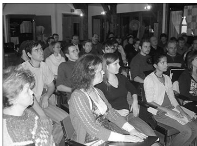
A konferencián résztvevő fiatalok