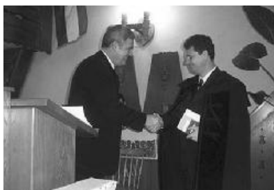
A kötet méltatója és a szerző.

Ezt követően az újdonsült teológiai doktor, a megszakításokkal nyolc évig tartó fo-