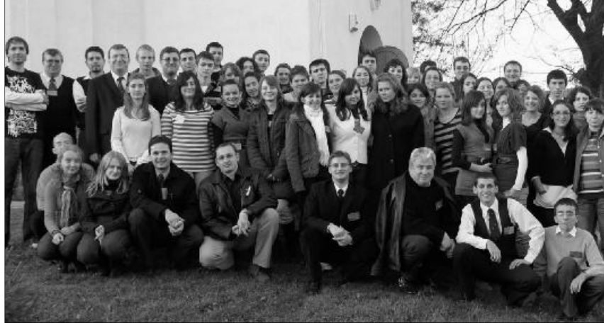
A harmadjára megszervezett vetélkedőt a házigazda magyarkéci ifjak nyerték

Harmadik alkalommal került megrendezésre egyházkerületünk bibliaismereti vetélkedője az Érmelléki Egyházmegye szervezésében, november 21-én. Ismételten a magyarkéci gyülekezet adott helyt a rendezvénynek. Ez alkalommal mind a 9 egyházmegye képviseltette magát egy-egy 4 tagú csapattal.