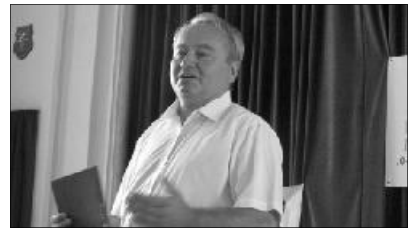
Csúry István püspök ünnepélyes beiktatására január 16-án kerül sor a nagyvárad-újravárosi templomban

– Nem vagyunk könnyű helyzetben. A világból reánk áradó félelmek, nyomorúságok tetőződése a küszöbön van, és hosszadalmas apadási folyamatnak nézünk elé. Ez a jelenség önmagában nem lenne gyilkos erejű, ha a gáton olyan építők és őrizők lennének, akik megélnék és másokkal is megértetnék, hogy Istennek hatalma van a mélyben is. Dávid erről, mint saját tapasztalatról így szól: „Lenyúlt a magasságból és felvett engem. S mélységes vizekből kihúzott engem.” (2Sám 22,17) A gáton nemcsak a csúcvezetőknek van helyük és felelőségük, hanem minden családfőnek, minden apának és anyának, minden közösség összes tagjának. Addig semmire sem megyünk, ameddig csak a leltározással foglalkozunk. Nem elég csak megállapítani azt, hogy vannak szegények és gazdagok, nem elég méricskélni magunkat másokhoz. Nem vezet semmire sem, ameddig nem értelmezzük és alkalmazzuk a kiválasztott nép profétájának adventi látomását, amely az akkori váradalomból mára már megvalósult volna, ha Krisztust valóban annak tekintenénk, mint Akinek mondjuk Őt. „Legyen az egyetlen egyenessé.” (És 40,4). A mélységben lévőeknek nem szabad feladniuk a küzdelmet, a magasságban lévőeknek nem