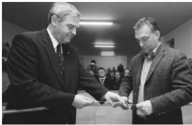
Tőkés László és Orbán Viktor a temesvári Új Ezredév Egyházközség gyülekezeti termének avatóján.

A volt püspök a temesvári gálaesten kezdeményezte a kommunizmus bűneinek temesvári perét: „Azt kérjük az Európai Uniótól, mint ötszázmillió polgár intézményes képviselőjétől, hogy az Egyesült Nemzetek Szövetségénél indítsa be a megfelelő eljárásokat egy olyan nemzetközi büntetőjogi rendszer kialakításának érdekében, amely lehetővé tenné a kommunizmus ideje alatt