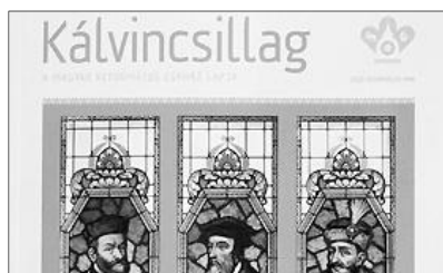
Az egységes református egyház valamennyi egyházrésze bemutatkozik a magazinban

A lap készítői gárdája a kilenc Kárpát-medencei egyházrész delegáltjaiból jött össze. A lap szerkesztői maguk közül választották ki a főszerkesztőt, Fekete Károlyt,