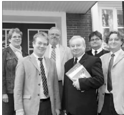
A diakóniai együttműködés lehetőségeiről is tárgyaltak

A testvéri látogatás hagyományteremtő kezdeményezés, a Németországi Református Egyház küldöttsége a közeljövőben felkeresi egyházkerületünket.