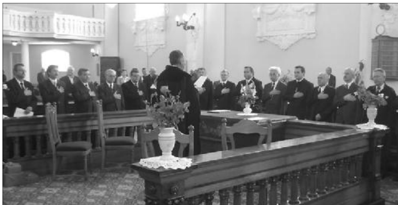
Az eskütétel pillanatai a Szatmárnémeti-Láncos templomban