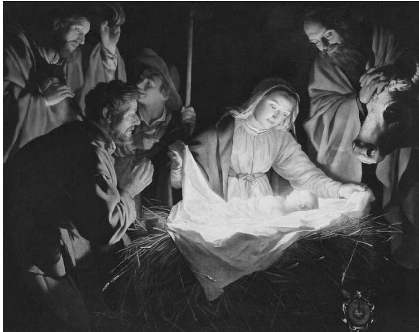
„Jer, mindnyájan örüljünk, / És szívünkben vigadjunk, / Mert született Úr Jézus nekünk.” (MRÉ 190/1) Gerard van Honthorst: Születés

Ha a házamat fenyőágakkal, gyertyákkal, égőkkel és csilingelő harangocskákkal díszítem fel, de a családom felé nincs bennem szeretet, nem vagyok egyéb, mint díszlet-rendező.