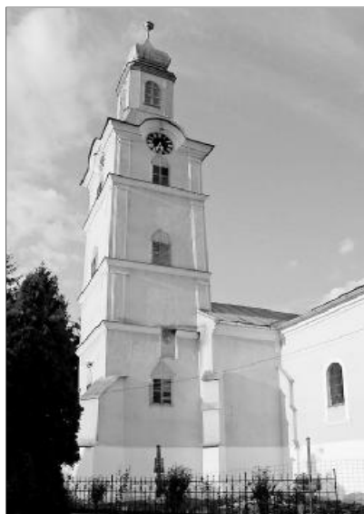
A szilágycsehi református templom

1989. december 26. - Népes gyülekezet közösségében ünnepeltük a ránk virradt karácsony másodnapját. Megjegyezni kívánom, hogy bejelentkezett légátusunk valamilyen ok miatt nem érkezett meg Szilágycsehbe, így egyedül maradtam az ünnepi szolgálattal. Ezen az istentiszteleten megismétltem a tegnapi hirdetését, majd ebéd után kimentem Menyőbe. Tőkés Lászlót a menyői ortodox templomban találtam meg. A református istentisztelet után az ortodox pap és hívei áthívták templomukba, ahol a román tévé riporterei felvételt készítettek az általuk tartott ökumenikus istentiszteletről.