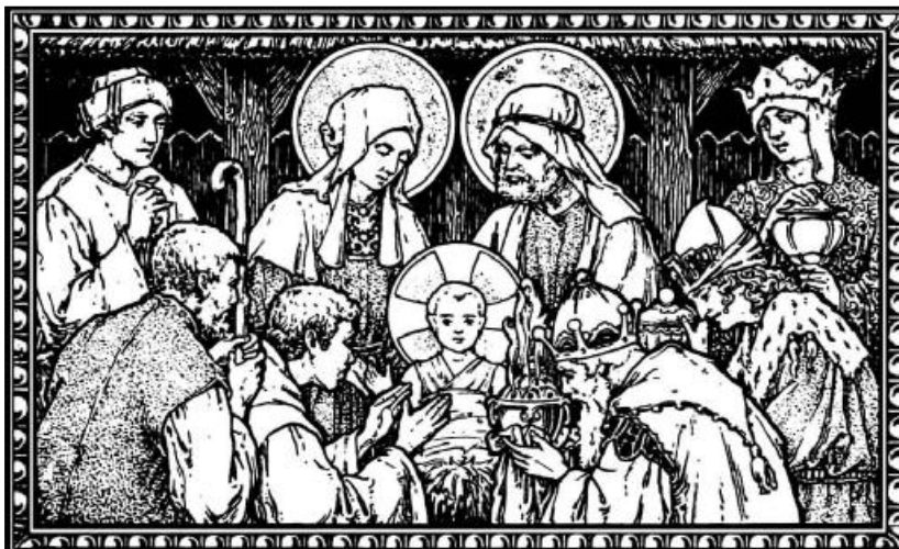
„A nemes Betlehemnek városába’ Gyermek született szűztől e világra” (MRÉ 201a/3).

Olyan gyermeki ártatlansággal bújtunk aztán otthon ágyba, hogy eszünkbe nem jutott volna az éjszaka bársonyos havában otthon is eljövendő angyalra leskelődni. Csak virradatkor az ablakon bekérezkedő világosságban nyílt hirtelen nagyra a szemem. Az asztalon ott állt a fenyő, csillogtak rajta sejtelmesen az aranyalmák, szaloncukrok. A fényes bronzal bemázolt diók és fenyőtobozok a világ legszebb ékségeiként incselkedtek a szememben. Szüleink ébredésére vártunk öcsémmel, sejtettük, az a titokzatos angyal külön ajándékot is hozott nekünk. Olyan szép háziállataink tán soha nem is voltak, mint az ajándékba kapott kirakós kockákon. Ritkán látni manapság dominót, de ha mégis, egy kicsit mindig leülnék játszani. S bár sohasem lettem nagy sakkozó, a sakkasztal látványa mindig eszembe juttatja az anyalt – Anyut –, akinek semmi se volt drága, ha gyermekeiről volt szó. Ugyancsak nagyocská legényke le-