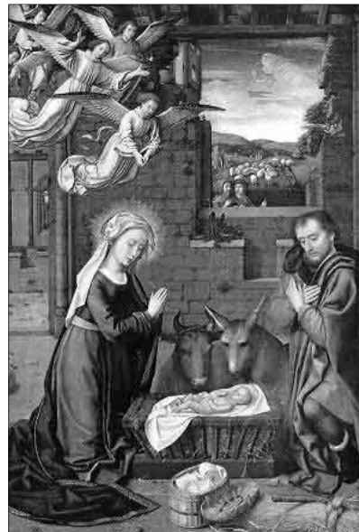
„Dicsérjük a szent angyalokkal, / Imádjuk a hív pásztorokkal” (MRÉ 194/3). David Gerard: Születés

Megörült ennek a hírnek Mária, mert ebből megértette, hogy a gyermek lesz a Megváltó, akit minden ember annyira vár. És ő lesz ennek a gyermeknek az édesanyja! Akkor csakugyan ő lesz a földön a legáldottabb anyuka. De egyvalamit nem értett Mária: – De hát ki lesz a gyermek apja? Józseffel még nem vagyunk összeházasodva! Az angyal azonban így válaszolt: – Nagy és csodálatos titok ez, Mária. Isten maga lesz a gyermek apja, hogy ez a gyermek örökké élhessen. Nem lesz közönséges gyermek. Isten Fiának fogják hívni. Mária mély tisztelettel fejet hajtott és így felelt: – Az Isten szolgálóleánya vagyok. Történjék minden úgy, amint mondottad.