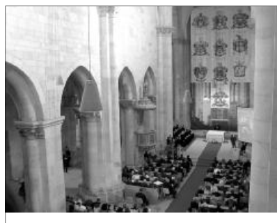
Több százan vettek részt a gyulafehérvári emléktábla-avatón.

REFORMÁTUS EGYHÁZVEZETŐK TANÁCSKOZÁSA. November 15-én, Kolozsváron tanácskozott a Generális Konvent elnöksége. A Kárpát-medencei református egyházak püspökeit és főgondnokait tömörítő közös ügyvivő testület úgy határozott, hogy az egyház közös költségvetését a soron következő február 26-i miskolci elnökségi ülésen hozzák végleges formába. Döntés született a Kálvincsillag magazinról is: a részegyházak szerkesztésében készül újság évente egy alkalommal jelenik meg. Az egyházvezetők végül döntöttek a Magyar Reformátusok VI. Világtalálkozójának 2011-ben esedékes megrendezéséről. A Generális Konvent plenáris ülését, pünkösöd