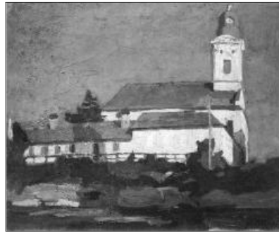
Maticska Jenő: A Híd utcai református templom – Nagybánya

Dániában történt, hogy egy ismeretlen ember nagy összeget adományozott jótékony célra. Mikor azt kérdezték, hogy mi a neve, Danielsen – válaszolta, lakáscímét is megmondta, de kiderült, hogy a név is és a cím is fiktív, mert ez a jó ember rejtve akart maradni. Az újságok is írtak a névtelen és címtelen adományozóról, és valóságos Danielsen-láz tört ki Dániában. Egyik adomány érkezett a másik után, s a földad mindenikeni Danielsen. Ha valaki pénzt nyomott az utcákon a koldus markába, a koldus így köszönt: köszönöm, Danielsen úr. Az új esztendőben jó lenne, ha sok jót, azaz a jót cselekedné, szívből, mint Mária és József, s