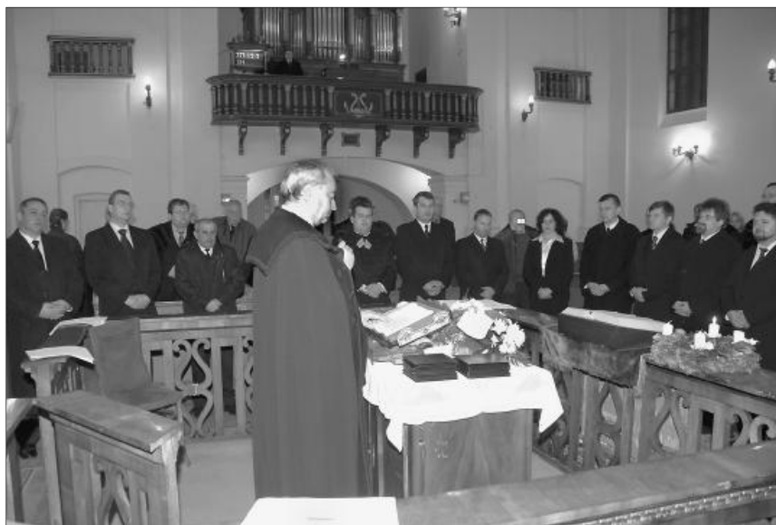
A tisztújítási folyamat záró mozzanata. A hat évre megválasztott egyházkerületi tisztségviselők eskütétele a várád-újvárosi református templomban.

December 4-én tartották a Királyhágó-melléki Egyházkerület közgyűlését, ahol a tisztújítási folyamat záró mozzanataként a megválasztott tisztségviselők eskütételére is sor került.