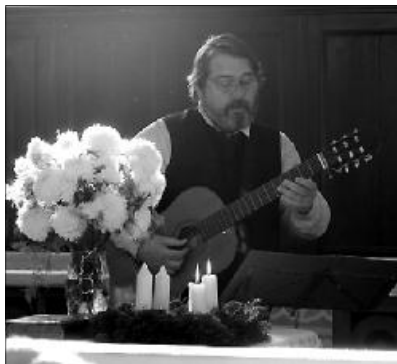
A „fegyvernemletétel napján”, a földre dobás helyett magasra emelnénk mai fegyvereinket: a könyvet, a tollat, a gitárt, a fakanelat... a józanság mai szabadságharcos eszközeit

Ezen gondolatokon morfondírozva folytatjuk utunkat visszafelé - előre Pankotára s a fegyverletételről történő megegyezés színhelyére Világosra, melyeknek kas-