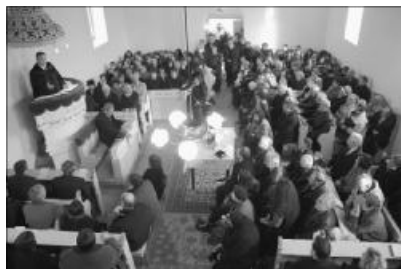
Ünnepi istentisztelettel kezdődött a 2010-es Érmindszenti zárándoklat

ÉRMINDSZENTY ZARÁNDOKLAT – 2010. November 20-án, Ady Endre 133. születésnapja alkalmából a Királyhágómelléki Egyházkerület (KRE) és a Partiumi Magyar Művelődési Céh szervezésében zárándokoltak el a költőóriás tisztelői Érmindszentre, Ady szülőfalujába.