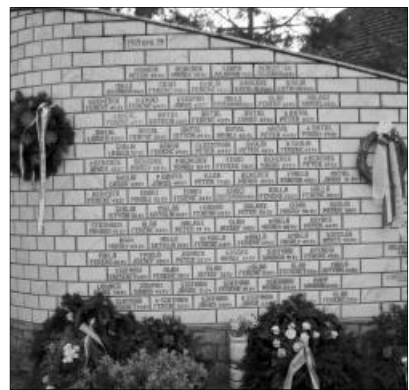
A tárkányi emlékmű, az áldozatok neveivel

KÖRÖSTÁRKÁNY FEKETE HÚSVÉTJA. 1919 nagypéntekén Köröstarványban és Kisnyégerfalván, a Székely Hadosztály visszavonulása nyomán előretörő román félkatonai alakulatok véres magyarirtást hajtottak végre. A tárkányi református templom előtti téren 91, a szomszédos Kisnyégerfalván 17 magyart végeztek ki. Hiteles adatok szerint 204 magyar gyermek jutott árvaságra. Az áldozatok sírköveiről a kommunista román hatalom lekapartatta az 1919. április 19-i dátumot, nehogy feltűnjön valakinek a sok sírkő ezzel a dátummal. A helybeliek 1999-ben leplezték le azt az emlékművet, amelyet az 1919-es öldöklés során, valamint az első és második világháborúban elhunyt tárkányiak tiszteletére emeltek. Azóta minden évben - nagypénteken - ott emlékeznek meg az áldozatokról.