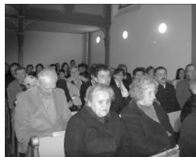
Megtelt a belényesi református templom