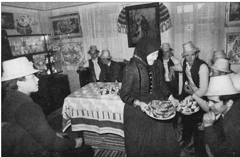
Süteménnyel kínálják az öntözőket