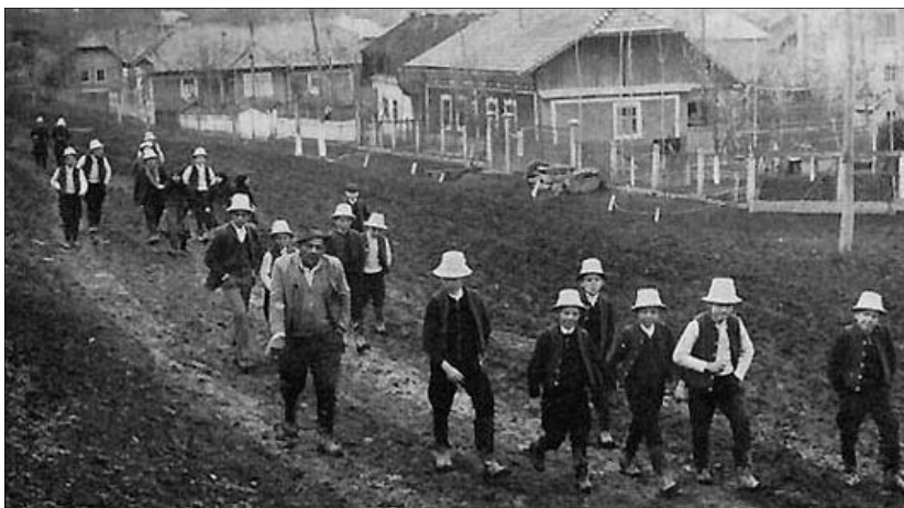
Öntözni induló aprók csoportja, Szék. Kunkovács László felvételei, 1974

Eljött a szép húsvét reggele, Feltámadásunk édes ünnepe. Ünneplő ruhákba öltöztek a fák, Pattognak a rügyek, s virít a virág. A harang zúgása hirdeti ünnepet, Egy kismadár dalol a zöld rétek felett. Tündérország rózsái közt gyöngyharmatot szedtem, Akit azzal meglocsolok, megáldja az Isten. Az illatos rózsavízről megőnének a lányok, Zsebeimbe beleférnek a piros tojások.