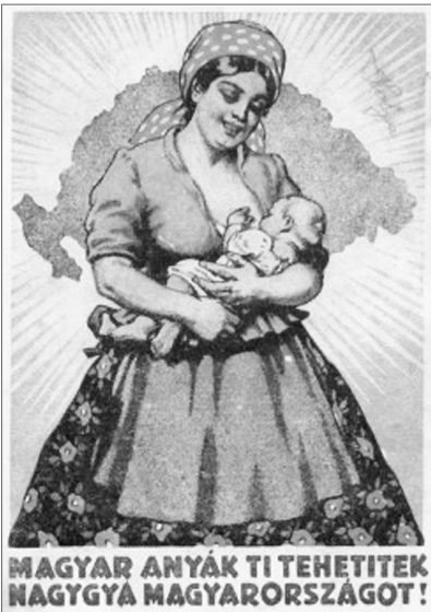
Aldás népszerűség egy Trianon utáni plakáton

Emlékszünk-e, emlékezhetünk-e arra, hogy a történelmi ország közepén élők, mit észlelhettek az „akkort” követően? Bizonyára mindenkinek fáj a nemzethalált jövendő júnus negyedike, és a délután fél ötöt jelző harangszó. Egy épeszű magyar ember, vagy egy hungarus tudatú, de más anyanyelvű ember akkor nem érezhetett mást, csak gyászt. Idézhetjük Karinthy Frigyesnek a levágott végtagokból kisugárzó fájdalomról fiának írt megrázó levelét, vagy Juhász Gyulának verssorait a tragédiáról: „Nem kell beszélni róla sohasem, / De mindig, mindig gondoljunk rá”. Mégis sokan voltak olyanok, akiknek csak annyit jelentett Trianon, hogy megváltoztak a gazdasági és a piaci viszonyok, emiatt szegényebbek lettek. Ráadásul a nyakukba szakadt néhány szerencsétlen menekült és otthonából kikergetett rokon, akiket nekik kellett el-tartaniuk az állam balsikerű politikája miatt. A Ferencvárosi rendező pályaudvaron pedig évekig álltak a vasúti teherkocsik tele, rokonság nélküli menekült felvidékiekkel, erdélyiekkel. Az események és a következmények megelőli egyszerre könnyeztek és káromkodtak. Az ország közepén élők annak örültek, hogy nem a széleken éltek az elcsatolások, akik pedig az új államhatár miatt a szélre kerültek, hálát adtak az Istennek, hogy nem két kilométerrel beljebb