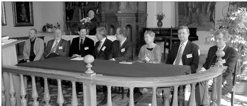
A konferencián több ország szakemberei tartottak előadást

A 375 éves liturgikus könyv. Az 1636-ban kiadott Öreg graduál olyan liturgikus könyv, amely tartalmazza az úrvacsorás istentiszteleteken, a reggeli és esti imaórákon énekelte magyar nyelvű gregorián tételeket. Az Öreg graduál és az ehhez hasonló 16. századi könyvek az európai protestantizmus történetének egyedi jelenségeként bizonyítják, hogy magyar nyelvtérületen a reformáció után is tovább élt az anyanyelven énekelte gregorián. Ezt az éneklési módot a 18. századig gyakorolták, tehát viszonylag hosszú ideig meghatározta mind a református, lutheránus, mind pedig az unitárius egyház istentiszteleteinek rendjét. (Reformatus.ro)