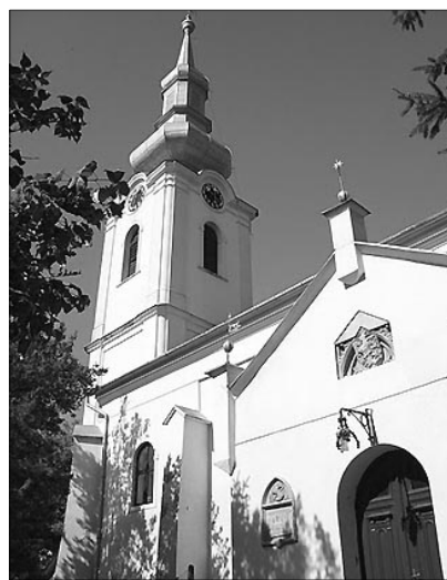
A székelyhídi református templom

✿ MEGHÍVÓ NŐSZÖVETSÉGI KONFERENCIÁRA (...) Ha Isten megtartja életünket, ez évi konferenciánkat 2011. július 23-án tartjuk Székelyhídon . Témája a 2011. évre meghirdetett önkéntesség: Önkéntesség Krisztus Urunk szolgálatában . Református nőszövetségünk munkájának a legáltalánosabb kifejezője, hiszen erről szól a küldetésünk. Szeretetszolgálat a gyülekezetben és a családban, diakónia, életszolgálat Isten egyházaért. Szeretettel hívjuk a nőszövetségeket és a gyülekezetek tagjait konferenciánkra. Kérünk írásokat a gyülekezeti szolgálatról, képes beszámolókat, imákat, verseket a konferencia-füzet számára. Beküldési határidő: június 1. Részvételi díj: 5 lej.