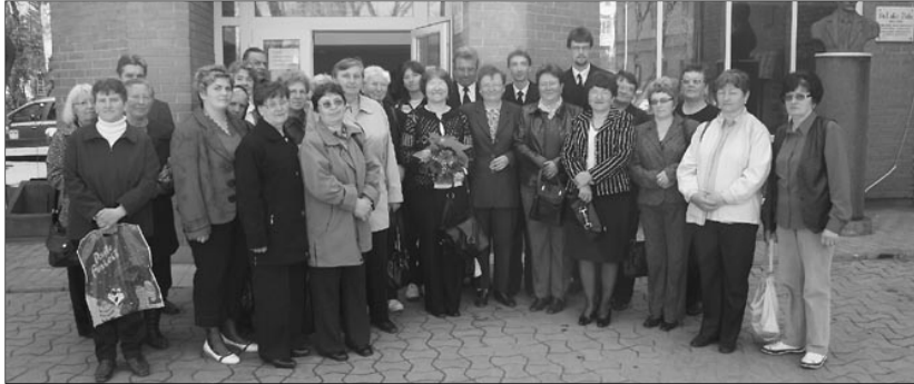
Az Áldott Orvos küldöttei. Több gyülekezet is képviseltette magát a szatmári kórházmisszióban

Nagyhét második napján a Szatmári Egyházmegye néhány lelkipásztorja és nőszövetségi tagja missziós szolgálatot végzett a szatmárnémeti 2-es számú Megyei Kórházban, közismert nevén a régi kórházban. Akárcsak legutóbb karácsony előtt, most is az örömhírt vitték a kórházban fekvő betegeknek.