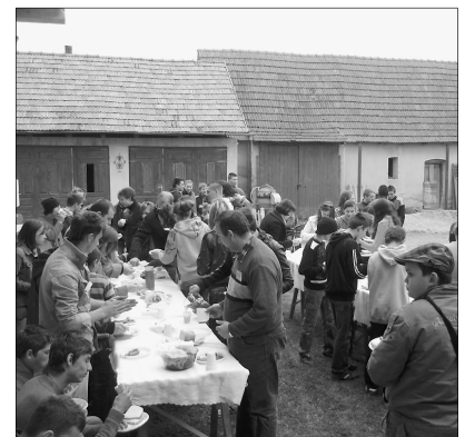
Terített asztal és finom ebéd várta az ifjúsági találkozó résztvevőit

A finom ebéd után játékos délután következett. A fiatalok nagyon élvezték, amint lelkipásztoraik és a vállalkozóbb kedvűek megcsillantják színészi tehetségüket egy-