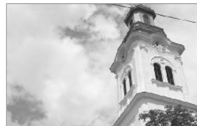
A tenkei református templom