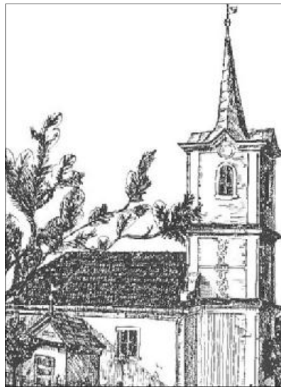
Miklós János: A belényessonkolyosi templom

A megváltás nem individuális. Krisztussal való kapcsolat nem merülhet ki magánéletben. A föltámadt életet ki kell vinni a világba az emberek és a társadalom üdvösségére. A Krisztussal való belső egyesülés fölszabadít a szorongástól és arra ösztönöz, hogy a valódi jövőt s az igazi békét éljük bele a mindennapi életbe. Ha igéi bennünk valóban lélek és élet, akkor szabadok és bátrak leszünk a világ hatalmasságaival szemben, akkor nagy szavak nélkül is alapvető tiltakozást jelentünk a személyes szabadságot eltérő szemében és mindenfajta manipulálás ellen. A Szentlélek hatására bennünk Krisztus, az Ige, lélekké és életté válik, így tudunk az ateista és materialista világban lelki sötétséget oszlatni, lelkiekkel másokat gazdagítani, új életet, új történelmet írni.