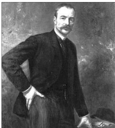
Benczúr Gyula: Tisza István, 1914

Az általunk tanulmányozott irodalomból kiemeljük A.G.M. Abbing művét, amely Trianon drámái következményeiről szól. A közzétett dokumentumok alapján Abbing 1931-ben arra a következtetésre jutott, hogy Tisza István 1914. július 1-jén és 7-én két memorandumban is a háború ellen foglalt állást. Azt, hogy július 19-én mégis hozzájárult a hadüzenethez, annak a mérlegelésével történt, hogy a hírszerzők tudomására hozták: Sassanov orosz külügyminiszter és Brătianu miniszterelnök szövetséget kötöttek és ennek fejében az oroszok Erdélyt felajánlották Romániának. Tisza miniszterelnök ekkor megfontolta, hogy miként birkoznának meg egy tízmillióos orosz hadsereggel. Mindenesetre írásban rögzítette, hogy a Szerbiával szembeni háború nem vezethet az ellenséges területek bekebelezéséhez.