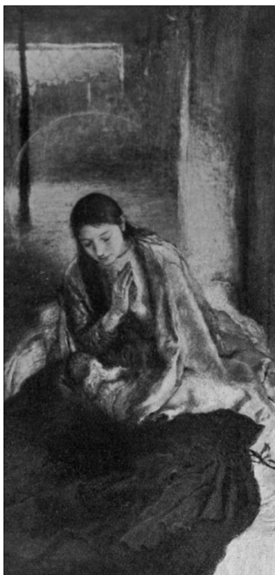
„Már lehozta az életet, Mely Istennél volt készített, Hogy ti is véle éljétek, Boldogságban örvendjétek.” (MRE/1914)

A föld sötét volt és hideg, mint a csillagtalan, zimankós téli éjszaka. Az emberek tapogatózó