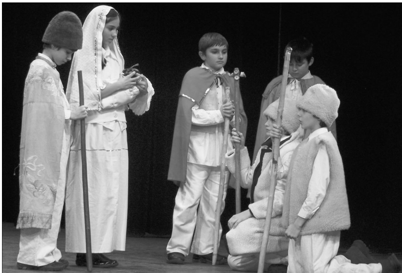
„Velünk lakik az Isten, / Nem vagyunk egyedül itt lenn, / Csendesedjék el szívünk / panaszja és félelme.”

Psszz! Nem mondom másnak, csak nektek. Különben fel is út, le is út, mehettek. Van itt egy tuti hely. De előbb tehettek valamit értem is... A téli szállásom. Van most a nyájaknál alkalmi állásom úgyis, hát átadom, nem bánom. Kiváló istállógarzon, természetes hőcserével.