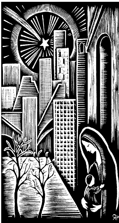
„Azért jöve, hogy éljünk, Isten kedvébe essünk, Erdemből kegyelmet nyerjünk.” (MRÉ 190/5) Radványi Károly alkotása