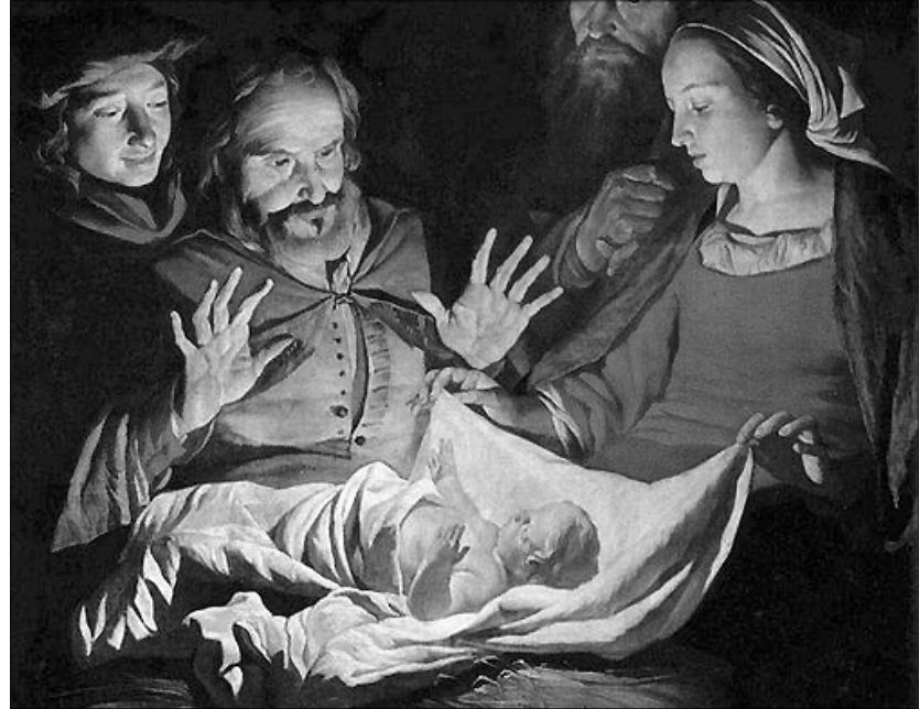
„Ó, Isten, hozzám kötéd így magadat, Hogy értem küldéd világra Fiadat”. (MRÉ 196/4) Gerard van Honthorst: A pásztorok imádása

lötték meg testvérei? Mert apja elkényeztette, kivétel tett vele és engedte, hogy álomlátásaival dicsekedjék.