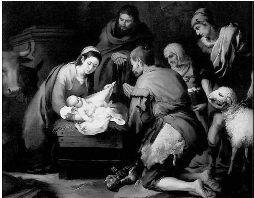
„Mert Isten Fia csodálatosan szállt le az égből, (...) hogy a Szűz csodálatosan hordozza méhében, hogy csodálatosan járjon e földön s függjön a keresztfán, hogy e világot, mint kezdettől fogva, mindenkor betöltse.” (Kálmán János: Institutio , II. könyv, XIII. 4.) Murillo: Pásztorok imádása

Mária és József egy ilyen csendes kis istállóban húzódtak meg. Boldogok voltak, hogy találtak helyet és hogy együtt lehetek. Ketten sokkal könnyebb elhordozni a nehézségeket. József szalmából ágyat készített Máriának, és betakargatta Máriát. Éjszaka volt Betlehemben. Kint sötét volt, csak a