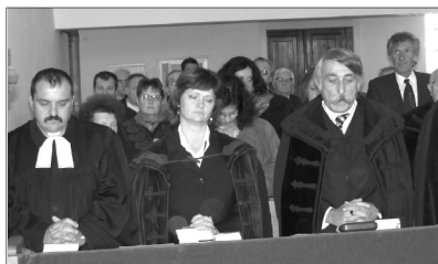
Karánsebesi ünnep. Hetven esztendő a százéves, elszórványosodott gyülekezet temploma

Az igehirdetés a Kol 3,10 alapján történt, amelyből a leglényegesebb gondolatot