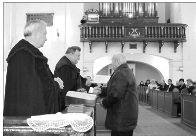
Negyedik alkalommal osztották ki a Czeglédi-díjakat