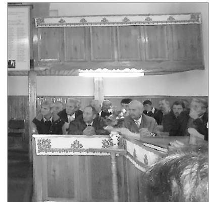
Isten kipótolja fogyatkozásainkat, bizzunk az Ő hűségében