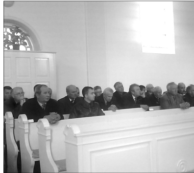
A hat körösközi református gyülekezet első alkalommal tartott kisköri presbiteri találkozót

a híveket, hogy egyenként búcsúzzanak el a megboldogulttól. Mikor belenéztek a koporsóba, mindenki a saját maga arcképét látta benne, s elgondolkozhatott, vajon él-e. Mi is, mikor megszámláltatunk, el kell gondoloznunk, hogy vajon élünk-e reformátusként és magyarként?