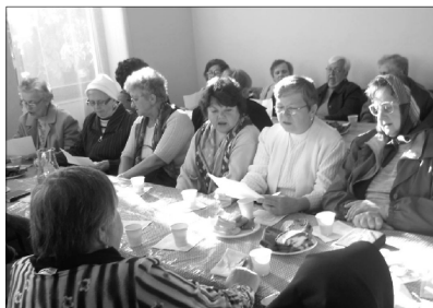
Minden belényesi idős magyar férfit és nőt szeretettel láttak

Ez alkalommal sok római katolikus testvérünk is részt vett az ünnepségen. Nótákkal, vicekkel, emelkedett hangulatban telt el a délután.