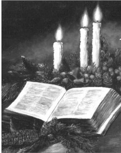
Isten népe, a keresztyén nép hirdeti: jön az Úr, és várja, állandó adventben élve készül Urának érkezésére

Noé napjaiban is észrevehették volna, de nem akarták meglátni. Észrevehették Noé kortársai, hogy valami készül. Bizonyára meg is kérdezték Noét, mit építesz és miért építed? Noé pedig elmondhatta, amit Istentől hallott, hogy gonosz a világ és Isten el fogja azt pusztítani. Épült a bárka napról napra, talán még el is jöttek páran, hogy nézzék, meddig tart ki az a bolond, és senki nem vette észre, hogy itt tényleg baj van, gondolkozzunk nosza el. Jónás figyelmeztető szavát a niniveiek szívükre veszik és megtérnek, Isten pedig meghagyja őket. Noé kortársai más emberek, nem akarnak tudomást venni Istenről, bűnről. Nem vettek észre semmit akkor sem, amikor Noé a családjával bement a bárkába, talán