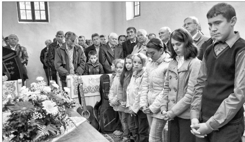
Október 23 a hála, az ünneplés, a boldog örvendezésnek a napja volt a gyülekezet számára

Szüless meg bennünk szeretet te legszebb lelki virtus, teremts bennünk új életet, szüless meg bennünk, Krisztus!