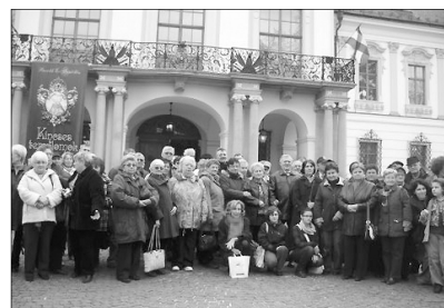
A várad-olaszi nőszövetség gödöllői kirándulása

A csodálatosan felújított gödöllői királyi kastély látogatása felejthetetlen élményt nyújtott mindannyiunk számára. Onnan a főtéri református templomba mentünk, ami szintén Grassalkovits Antal építetett. A templomot a 19. században bővítették, az