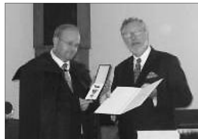
Az elismerés ünnepélyes átadása

✿ ÚJSZÖVETSÉG MAGAZIN FORMÁBAN. Képes magazin formájában jelentették meg az Újtestamentumot Németországban húsvétra. A kiadóban, Andreas Volleritschben két éve merült fel a gondolat, hogy látványra érdekesebb formában kellene közzétenni az Újszövetséget, mert igencsak fáradalmas egy apróbetűs nyomtatású Bibliát végigolvasni. A magazin 244 oldalas, harmincezer példányban adták ki. Nemcsak Németországban, hanem Ausztriában és Svájcban is kapható újságárusoknál, vasútállomásokon, repülőtereken. A kiadó tervezi, hogy az Ószövetséget is hasonlóan képes formában teszi közzé. (MTI)