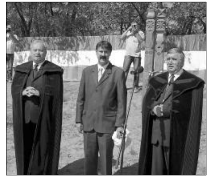
A létrehozandó Református Nemzeti Emlékparkban kopjafa-avatóra került sor