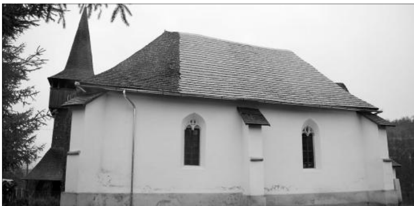
A menyői református templomban is található reneszánsz faragványok

Az egyházkerület műemléktemplomainak többsége nem egyetlen építési vagy