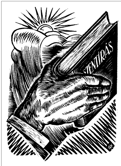
„A teljes írás Istentől ihletett és hasznos a tanításra, a feddésre, a megjobbításra és az igazságban való nevelésre.” (2Tim 3,16) Radványi Károly grafikája

2. A második helyre emeljük az Istenről, Jézus Krisztusról szóló tanítást , mely szerint Isten mindenható, Úr és Király, aki uralkodik mennyen és földön, életen és halálon. Szavával teremtette a világot, melyet akarata