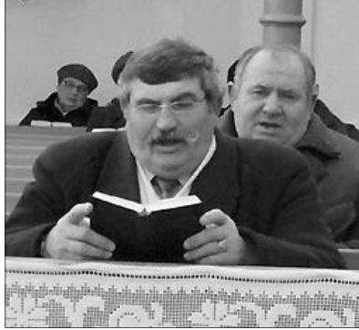
Ébresztgetés, emlékeztetés, ez az a két kulcsszó, mely a több mint két évtizednyi presbiteri és gondnoki szolgálatot jellemzi