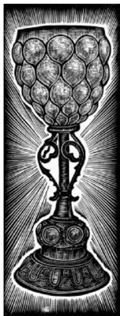
„Aki abból a vízből iszik, amelyet én adok, az nem szomjazik meg soha többé.” (Jn 4,14) Radványi Károly alkotása

– Pluralitásban, vallásszabadságban a világon először Erdélyben élt négy törvényesen bevett vallásfelekezet. A katolikus egyház szabadsága a reformáció után is megmaradt. 1550-től pedig az evangélikus, 1564-től a református, 1571-től néven nevezett az antitrinitárius (későbbi nevén unitárius) is törvényesen biztosított szabad vallásgyakorlatot kapott az egyenjogúság alapján. Érdekes, hogy bár törvényileg nem volt bevett felekezet a bizánci rítusú, későbbi nevén görögkeleti egyház, de az is szabadon tevékenykedhetett. A Magyar Királyságban a Bocskai-szabadságharcot lezáró bécsi béke és az azt 1608-ban törvénybe iktató cikkelyek biztosítottak három bevett vallásfelekezetnek, a katolikusnak, evangélikusnak, reformátusnak szabad vallásgyakorlatot, az utóbbi kettőnek egyházi önkormányzatot. A bizánci rítusú egyház a Magyar Királyságban is szabadon gyakorolhatta hitét, noha nem tartozott a bevett vallásfelekezetek közé. A vallásszabadság a lelkiismereti szabadság fontos része, ami szintén a reformáció magyarországi vívmányai közé tartozik.