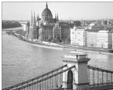
Budapest építészeti értékeit tekintették meg a Nagykaroly-belvárosi eklészia kirándulói

Délután fél három volt, amikor az Országház melletti parkolóban állt meg autóbuzunk, 50 kirándulóval. Belépve a Parla-