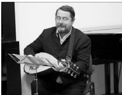
A „daltulajdonos” dallamos, verses előadásorozatot hirdetett